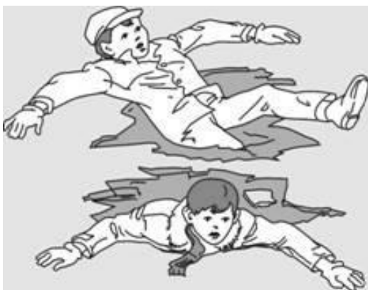
Попытки вылезти самому из полыньи грудью или спиной

Если вы провалились под лед, широко раскиньте руки, навалитесь грудью или спиной на лед и постарайтесь вылезти на него самостоятельно, зовите на помощь.