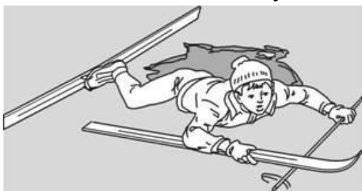
Попытки вылезти самому из полыньи с лыжами

Провалившемуся необходимо внушить, чтобы он широко раскинул руки на льду и ждал помощи, так как самостоятельная попытка вылезти из воды может привести к новому обламыванию кромки льда и очередному погружению пострадавшего под лед.